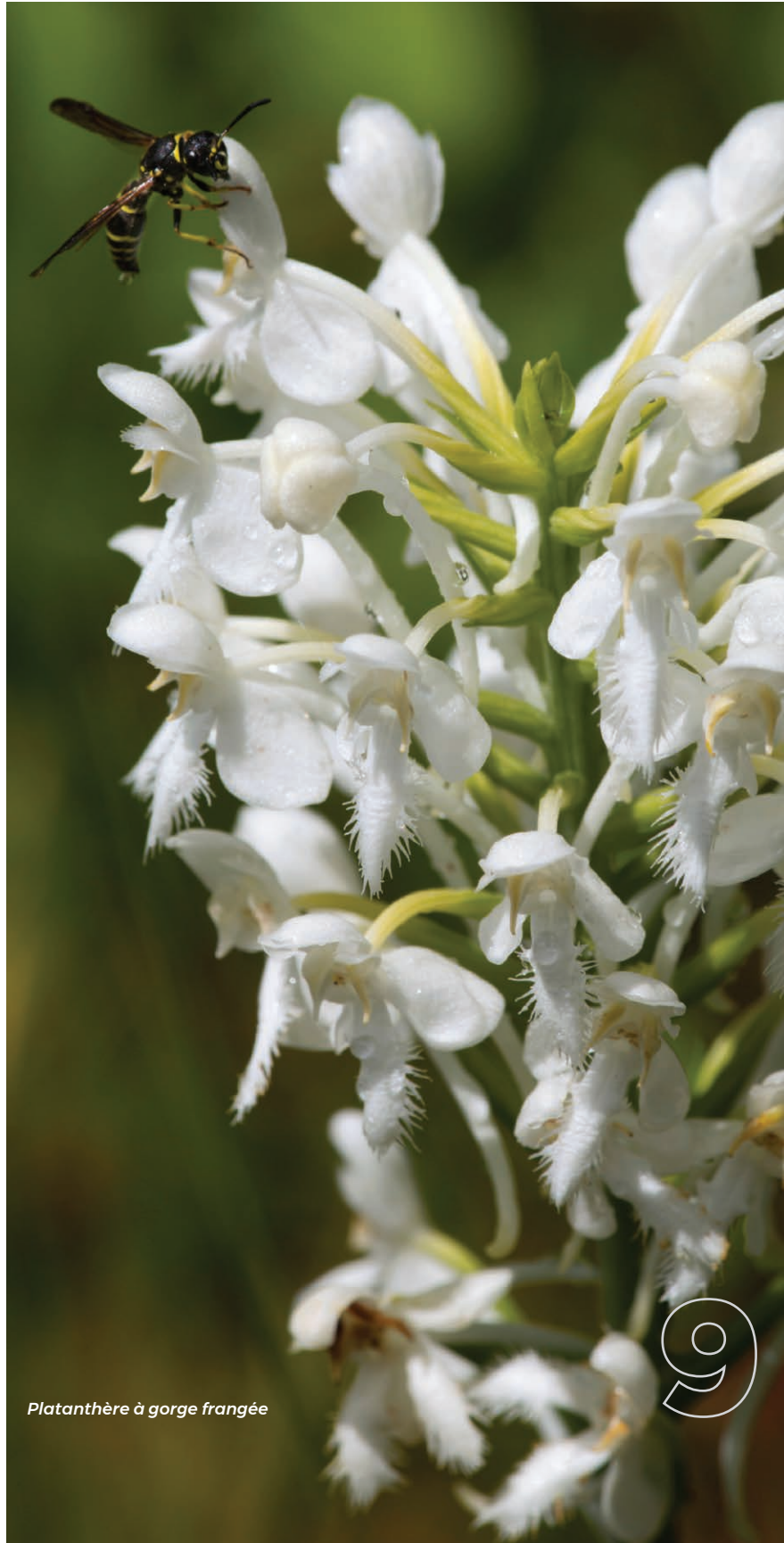
Platanthère à gorge frangée

Il importe de mentionner que ces superficies ne s'ajoutent pas au pourcentage du territoire comptabilisé à titre de milieu naturel. Retenons toutefois que leur fonction de communication contribuera à maintenir la qualité écologique des milieux naturels.