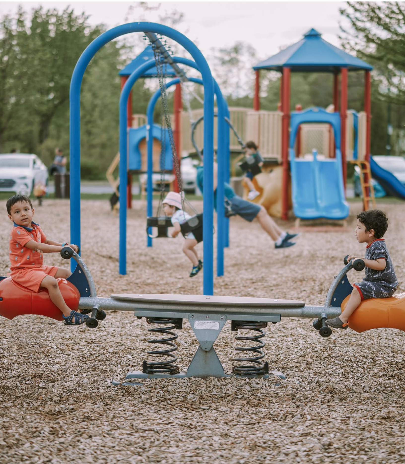
Photo prise au parc Daniel-Johnson.