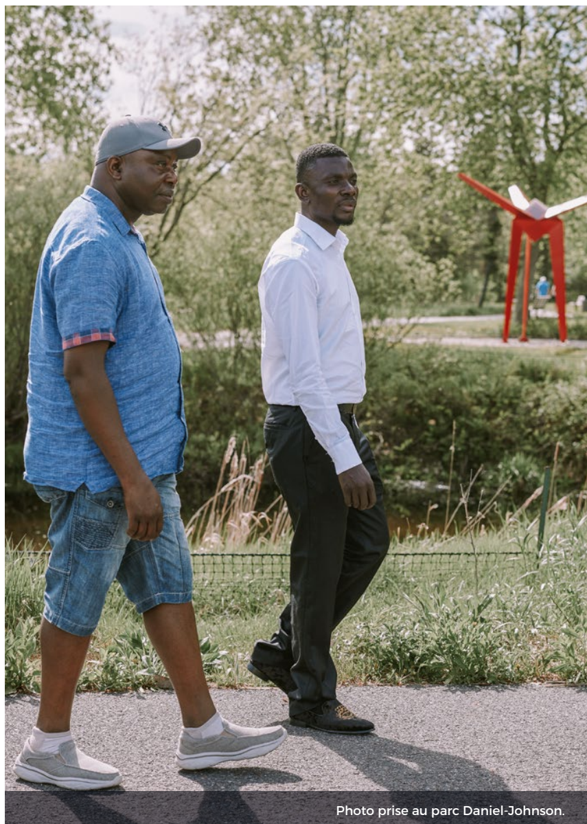
Photo prise au parc Daniel-Johnson.

Le diagnostic du milieu pour l'élaboration de ce plan d'action a été établi à partir d'un rapport produit par Solidarité Ethnique Régional de la Yamaska. Celui-ci comprend notamment un portrait de l'immigration ainsi qu'un répertoire des services et des organismes œuvrant auprès des personnes immigrantes sur le territoire.