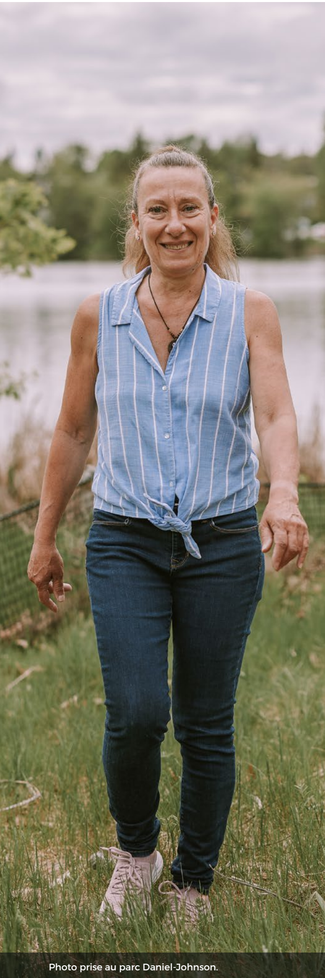
Photo prise au parc Daniel-Johnson.