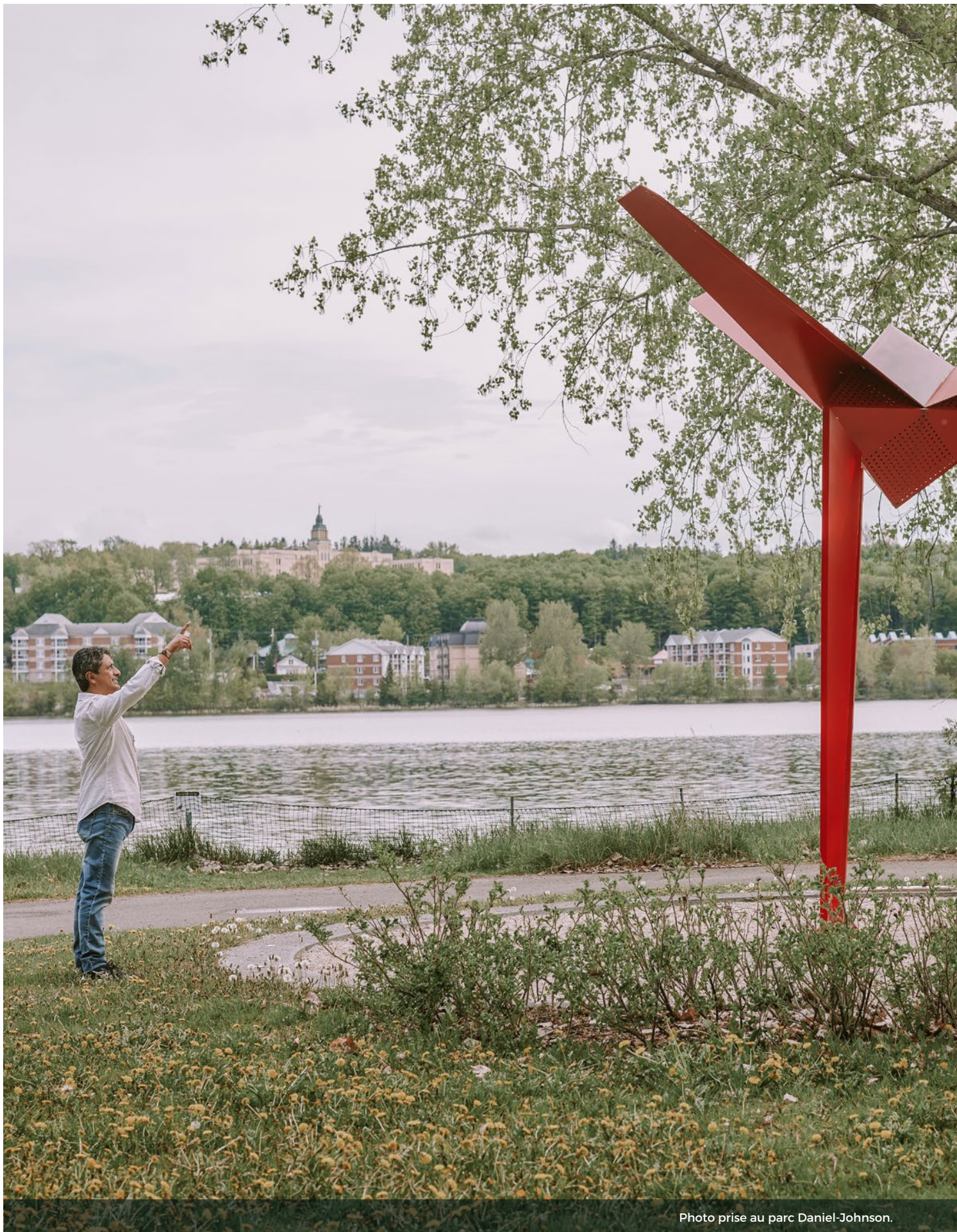
Photo prise au parc Daniel-Johnson.