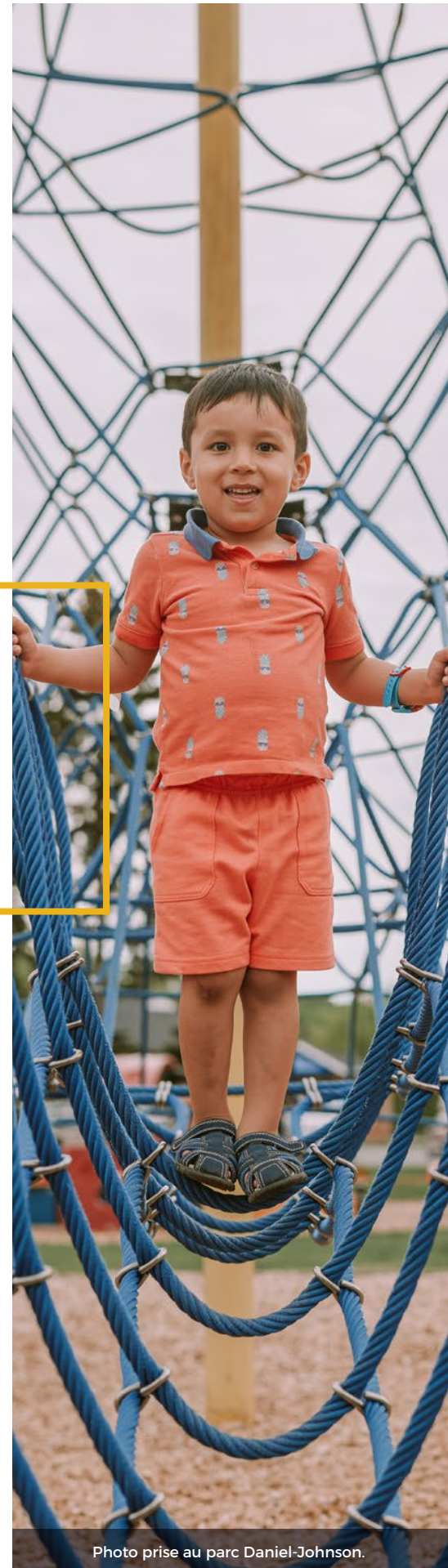
Photo prise au parc Daniel-Johnson.

Conséquemment, une augmentation du rapport de dépendance démographique est projetée. L'un des moyens pour combler l'écart et assurer la croissance démographique est de recourir à l'immigration internationale.