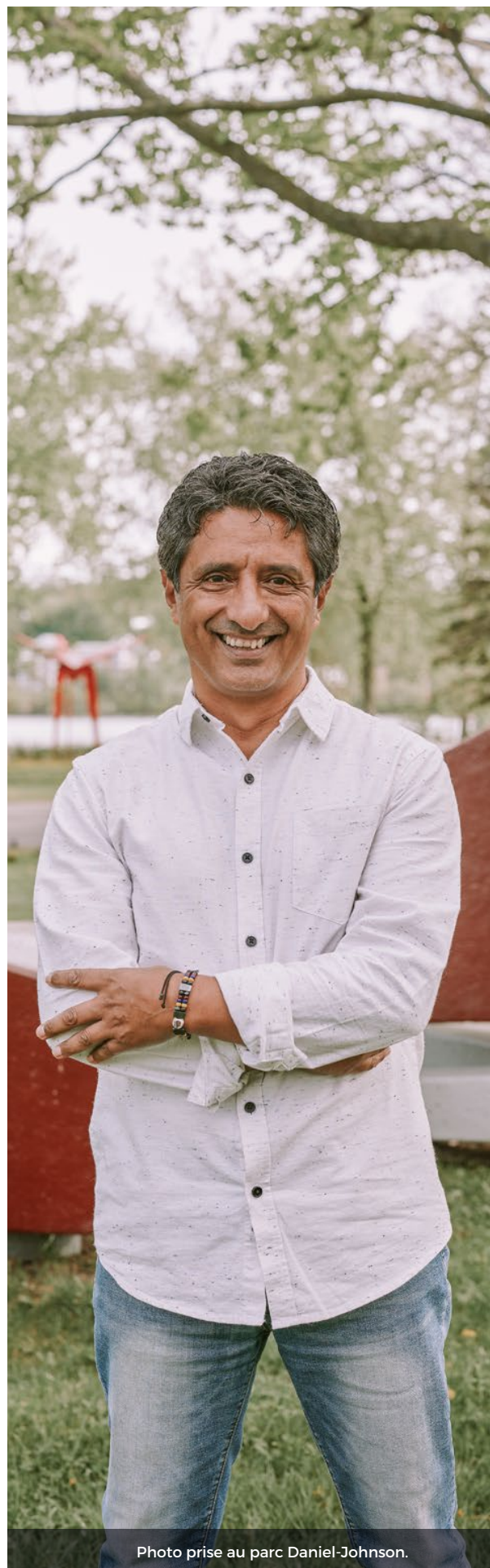
Photo prise au parc Daniel-Johnson.